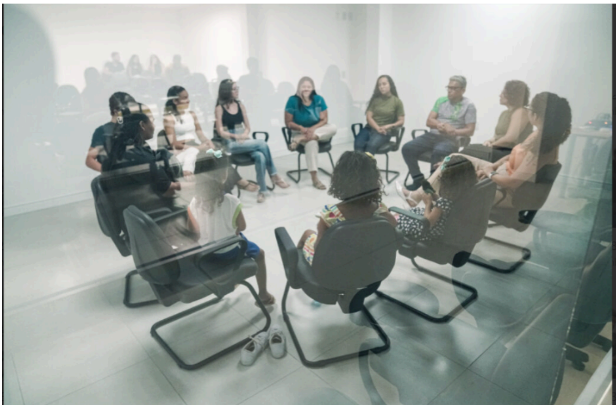
Imagem C - Acolhimento interprofissional aos usuários no CAAIS.