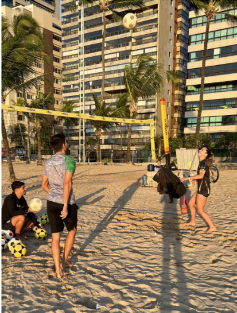
Imagem E - Estágio em vôlei de praia como modalidade de esportes coletivos.