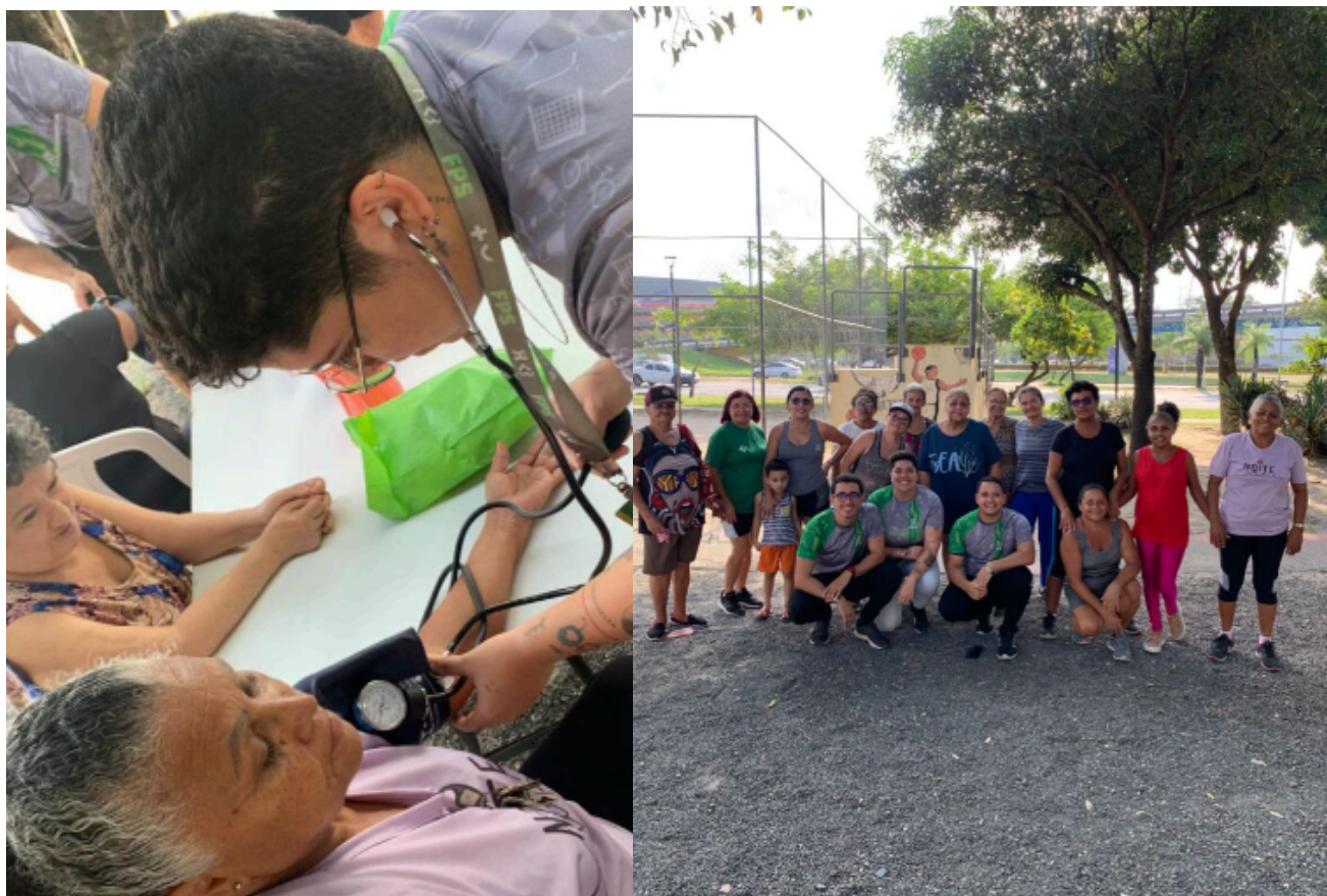
Imagem A - Estudantes no projeto Lazer na Praça.