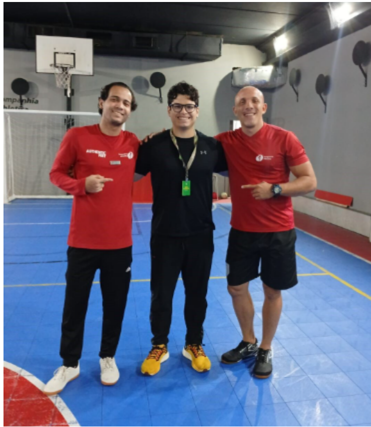
Imagem C - Estágio em basquetebol como modalidade de esportes coletivos.