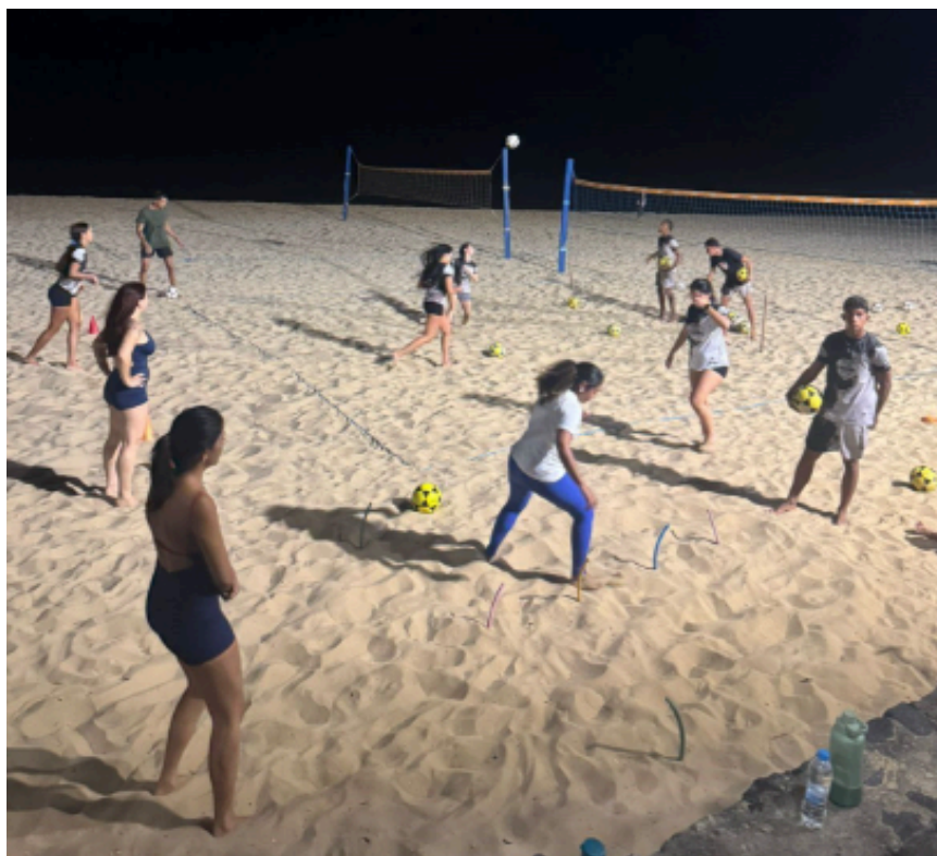
Figura 02 - Estágio em vôlei como modalidade de esporte coletivo.

O Estágio Supervisionado II – Esporte contempla cenários relacionados às práticas esportivas individuais e coletivas, em contextos competitivos e não competitivos, abrangendo diferentes faixas etárias e níveis de desempenho (figura 02). Os campos de estágio incluem clubes, escolinhas esportivas, centros de treinamento, projetos sociais, equipes esportivas, instituições educacionais não formais e eventos esportivos. Nessa etapa, o manual destaca a importância da vivência dos processos de treinamento esportivo, incluindo planejamento de sessões, controle de carga, análise de desempenho e acompanhamento de atletas, sempre sob supervisão qualificada (FPS, 2025).