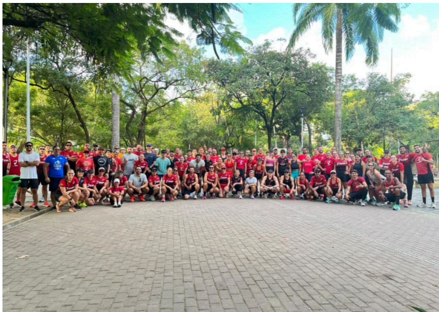
Imagem D - Estágio em corrida como modalidade de esportes individuais.