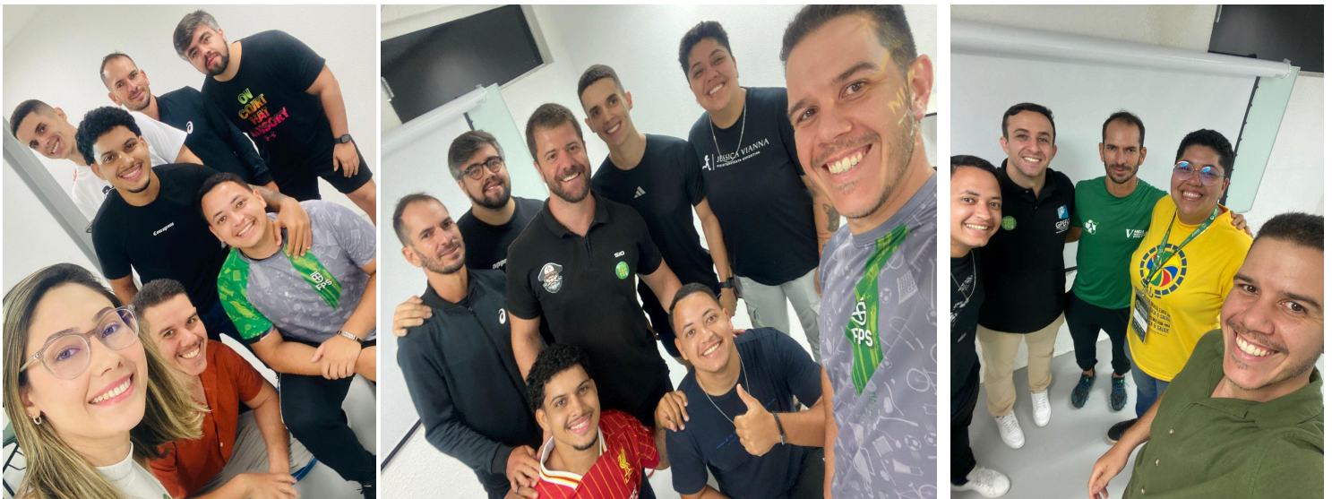
Figura 06: Estudantes, tutor e palestrantes no Ciclo de Palestras em Lazer e Gestão na Educação Física da FPS

24 de setembro e 06 de novembro. O evento reuniu profissionais atuantes em secretarias municipais, clubes esportivos, projetos sociais, empresas de recreação, espaços públicos, empreendimentos turísticos e instituições privadas, proporcionando aos estudantes contato direto com diferentes realidades do campo. Essa iniciativa buscou articular as experiências vivenciadas no estágio com a problematização do cenário profissional, contribuindo para ampliar a compreensão dos estudantes acerca das possibilidades de atuação, dos desafios enfrentados pelos profissionais e das tendências emergentes na área, promovendo também um espaço de diálogo e troca com os alunos para que, coletivamente, analisassem e refletissem criticamente sobre esse contexto.