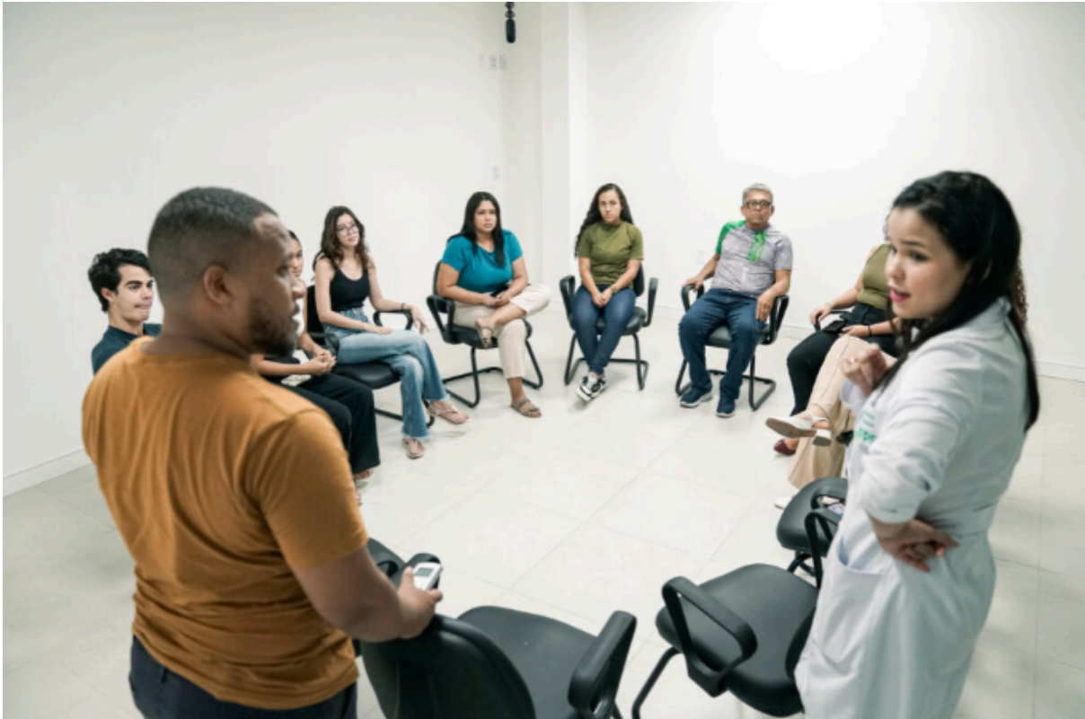
Imagem B - Reunião de aconselhamento interprofissional entre tutores e discentes no CAAIS.