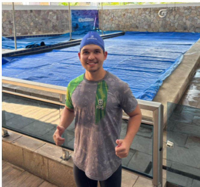
Imagem A - Estágio em natação como modalidade de esportes individuais.