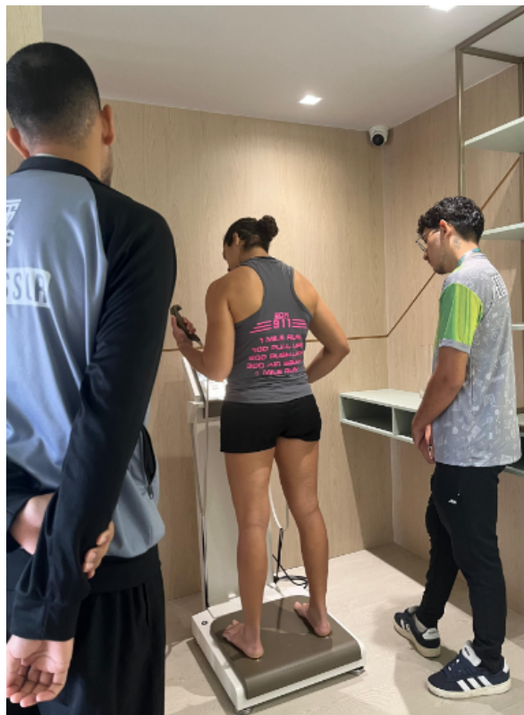
Figura 01 - Avaliação física realizada por estudante sob orientação do supervisor de estágio na FPS Gym.

de Atenção e Aprendizagem Interprofissional em Saúde) e o Laboratório de Performance Humana – FPS GYM , academia escola locada na própria instituição (figura 01). Conforme orientações do manual de estágio supervisionado da FPS, essa etapa tem como foco a inserção progressiva do estudante em práticas de cuidado em saúde, com ênfase na observação qualificada, no planejamento de intervenções e na atuação supervisionada em contextos reais, articulando teoria e prática (FPS, 2025).