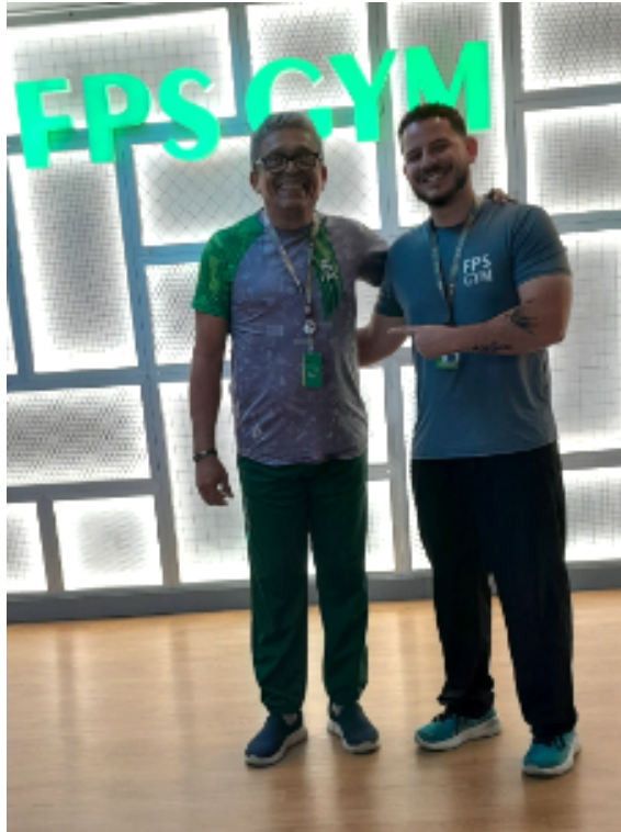
Imagem A - Estudante e supervisor de estágio na FPS GYM.