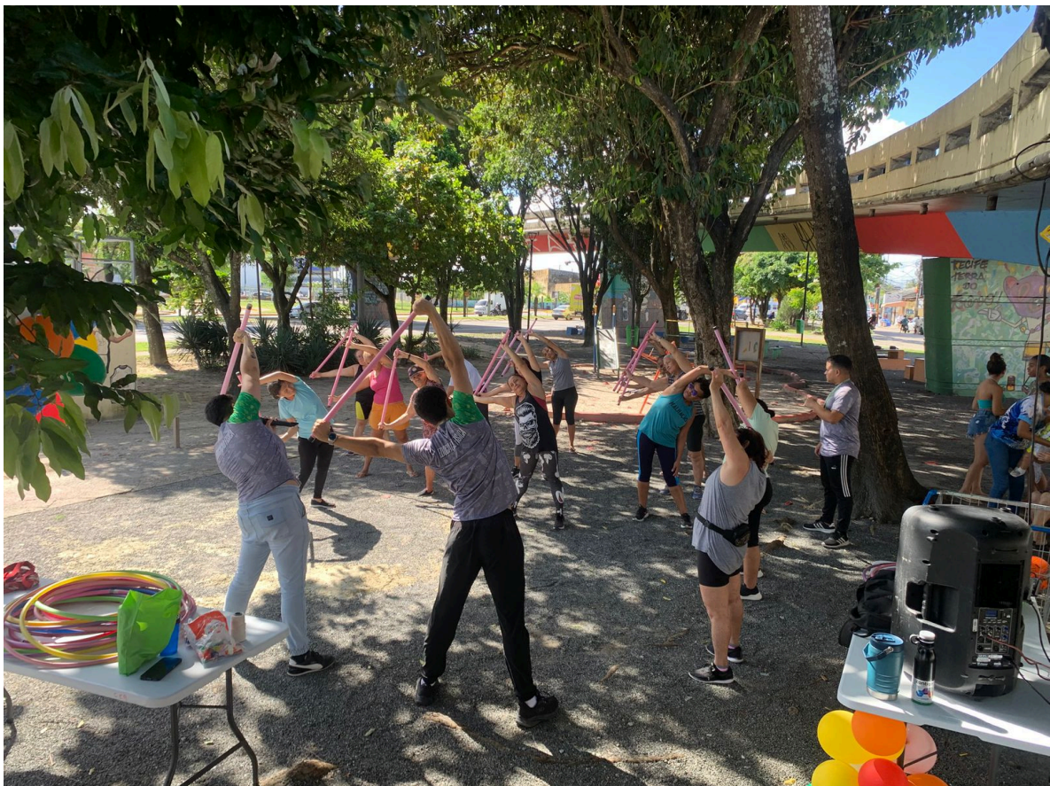
Figura 03 - Estágio em lazer (Lazer na praça) realizado na Praça Antônio Carlos Figueira.

O Estágio Supervisionado III – Lazer e Gestão direciona-se aos cenários que envolvem a organização, a gestão e a promoção de práticas corporais de lazer em diferentes contextos sociais. As atividades ocorrem em espaços como clubes, parques, praças, centros comunitários, hotéis, instituições públicas e privadas, bem como em projetos e políticas públicas voltadas ao lazer e à qualidade de vida. No semestre 2025.2, avançamos instituindo o Projeto Lazer na Praça , viabilizado em parceria com o setor de Responsabilidade Social da FPS e acompanhado por um docente-tutor do curso de Educação Física. A iniciativa tem como objetivo fomentar práticas de lazer e atividade física junto à comunidade do entorno da instituição, por meio de intervenções orientadas pelo professor responsável e desenvolvidas com a participação dos estudantes vinculados ao Estágio Supervisionado em Lazer. (figura 03). De acordo com o manual institucional, essa etapa busca desenvolver competências relacionadas à gestão de programas, organização de eventos, liderança de equipes e planejamento de ações voltadas à promoção da saúde e do lazer (FPS, 2025).