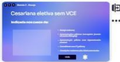
25 | Cesariana sem VCE