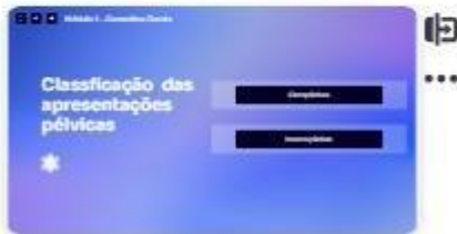
10 | Classificações das apres...