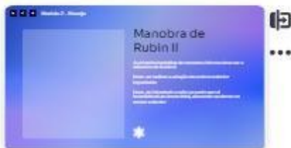
19 | Manobra de Rubin II