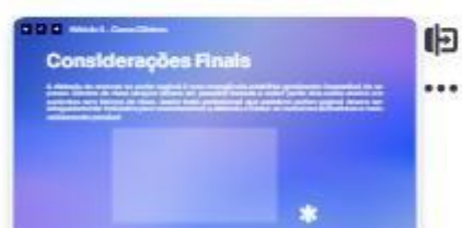
40 | Casa B - 1