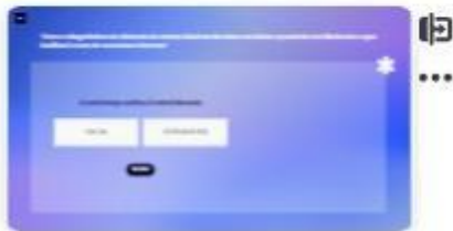
36 | Caso B - 2