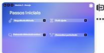
12 | Passos Iniciais