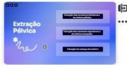
29 | Extração pélvica litotomia