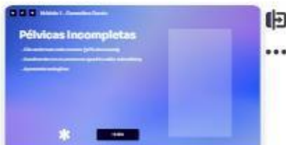
12 | Classificação - pélvica in...