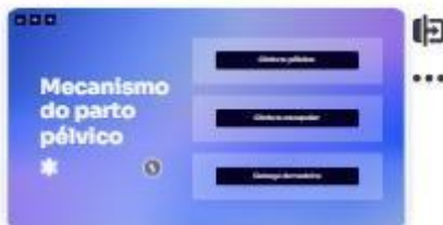
28 | Mecanismo de parto