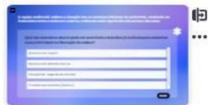
32 | Caso A - 5