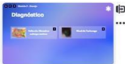
11 | Diagnóstico