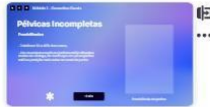
14 | Classificação - prociênc...