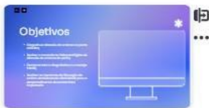
2 | Objetivos