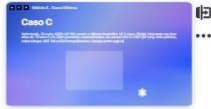
38 | Caso C-1