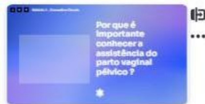
5 | Introdução 2