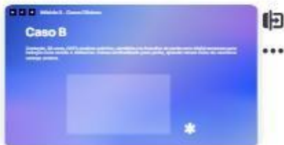
35 | Caso B - 1