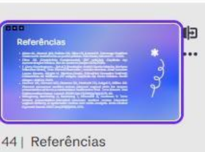
44 | Referências