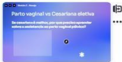
20 | Cesariana x parto vaginal