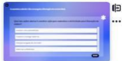
38 | Caso B - 4