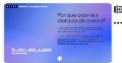
7 | Fisiopatogenia