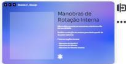
18 | Manobra de rotação Inter...