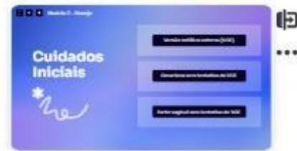
22 | Passos iniciais