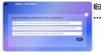
37 | Caso B-2