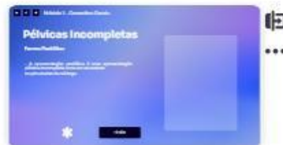
16 | Classificação - forma pod...