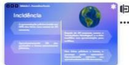
6 | Incidência 1