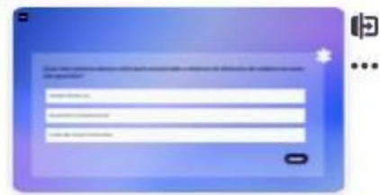
29 | Caso A - 2