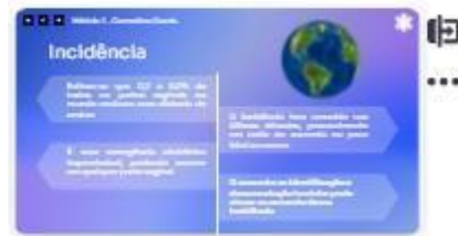
8 | Incidência