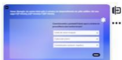
39 | Caso B - 5