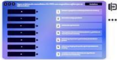
41 | Revisão