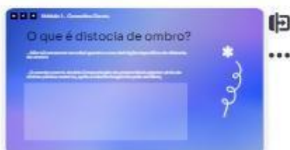
4 | conceito 1 - 1