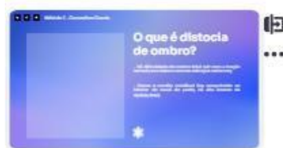
5 | conceito 1-2