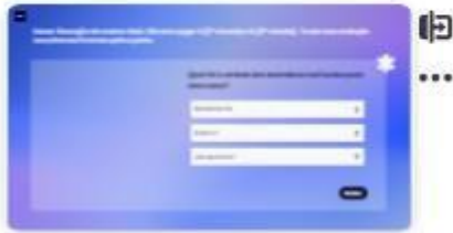
34 | Caso A - 7