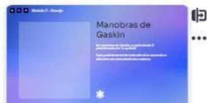
23 | Manobras de Woods reve...