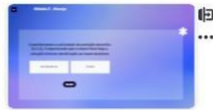
21 | Caso A - 3