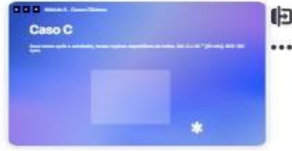
40 | Caso C-3