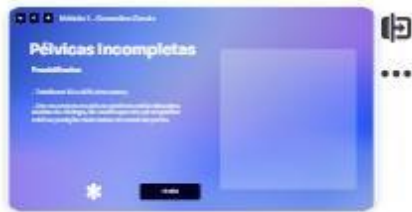
18 | Classificação - forma pod...