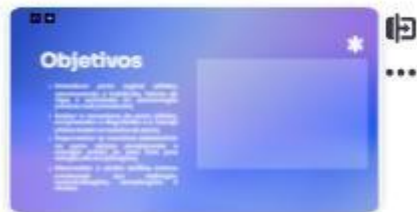
2 | Objetivos