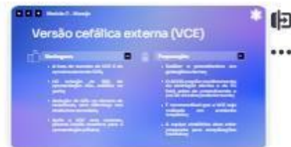
23 | VCE 1