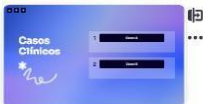
27 | Casos clínicos