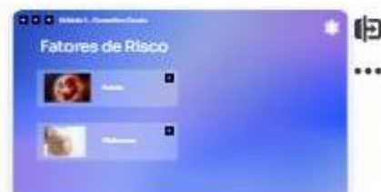
8 | Fatores de risco