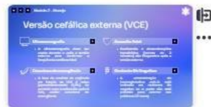
24 | VCE 2