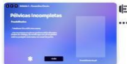
15 | Classificação - prociênc...