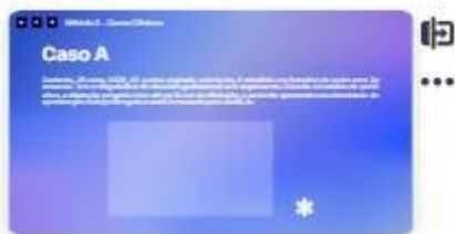
28 | Caso A - 1