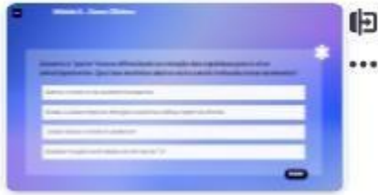
34 | Caso A-5