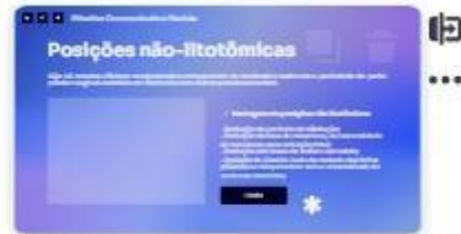
30 | Extração pélvica não litot...