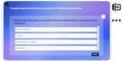
37 | Caso B - 3