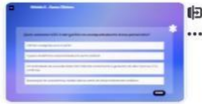
39 | Caso C-2