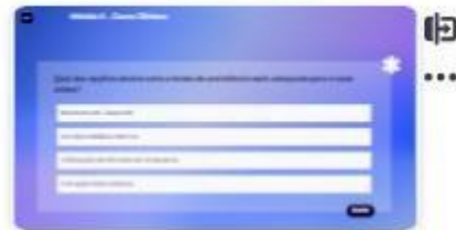
32 | Caso A-2