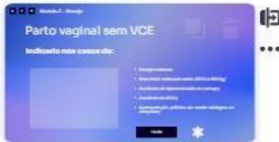
26 | Parto vaginal