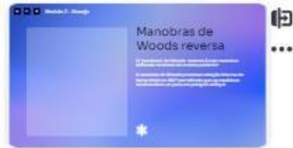
21 | Manobras de Woods reve...