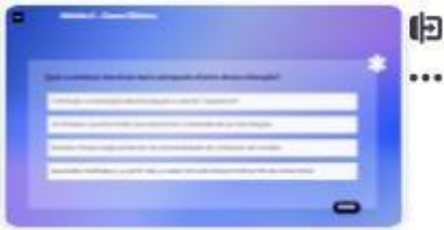
41 | Caso C-3