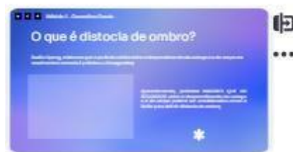
6 | conceito 1-3