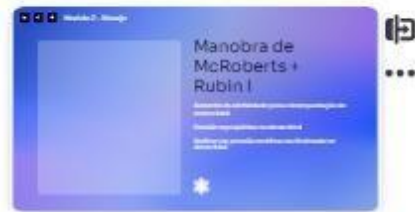
16 | Manobra de McRoberts + ...