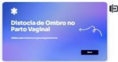
1 | Título