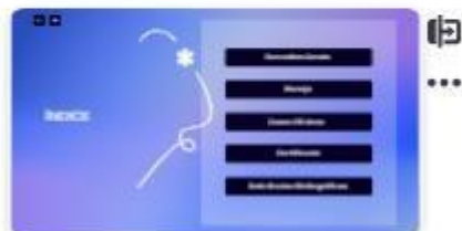
3 | Índice