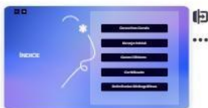
3 | Índice