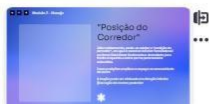
24 | Manobras de Woods reve...