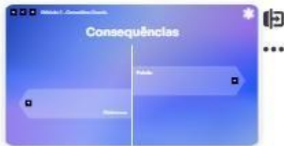
10 | Consequências