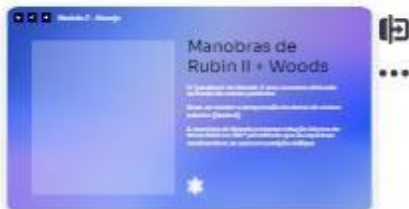
20 | Manobras de Rubin II + ...