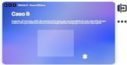
36 | Caso B - 1