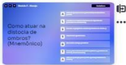
25 | ALEEERTA