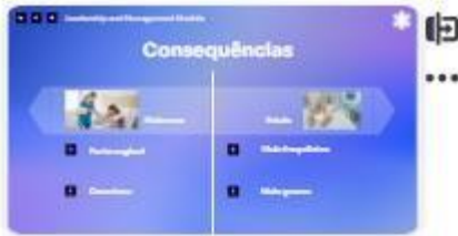
9 | Consequências