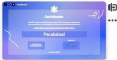
42 | CERTIFICATE