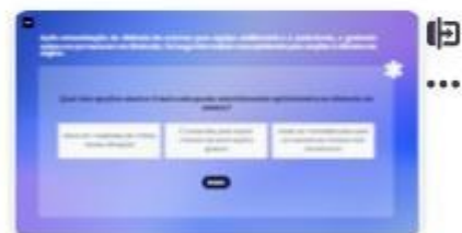
31 | Caso A - 4