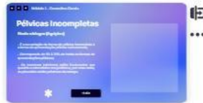
13 | Classificação - modo nád...