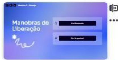
13 | Manobras de liberação