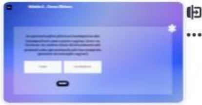
33 | Caso A - 4