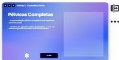
11 | Classificação - pélvica