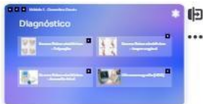
19 | Diagnóstico