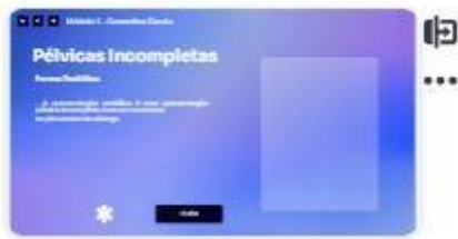
17 | Classificação - forma pod...