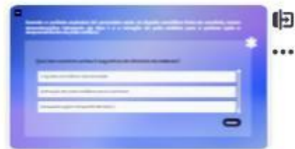
30 | Caso A - 3