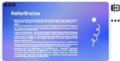
43 | Referências