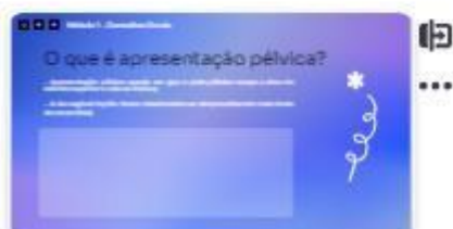
4 | Introdução 1