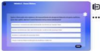
35 | Caso A-6