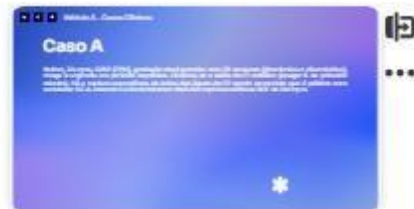
31 | Caso A-1