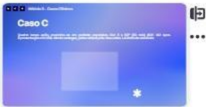
42 | Caso C-4