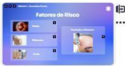
9 | Fatores de risco