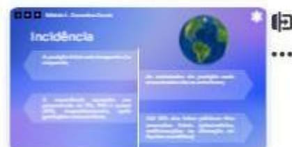
7 | Incidência 2