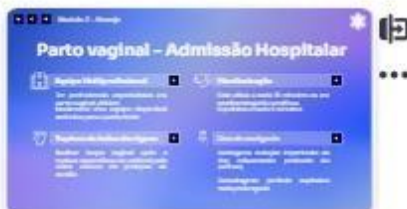
27 | parto vaginal pélvico