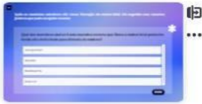
33 | Caso A - 6