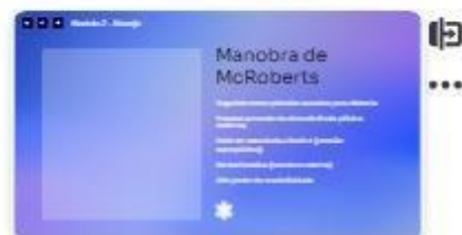
15 | Manobra de McRoberts