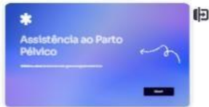
1 | Parto vaginal pélvico