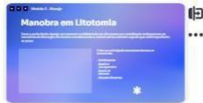
14 | manobras em litotomia