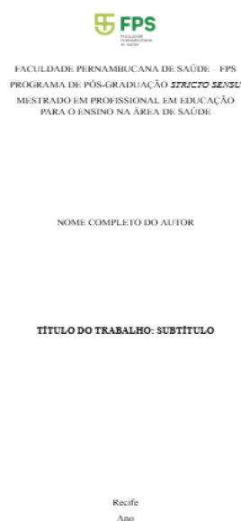
Figura 1. Modelo de capa