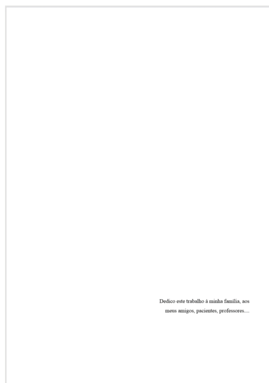
Figura 5. Modelo de folha de dedicatória

Elemento opcional onde o autor dedica seu trabalho ou presta uma homenagem a alguém. Não se deve intitular esta página e o texto deve ser inserido na parte inferior da página com recuo à direita de 8 cm, conforme exemplo a seguir.